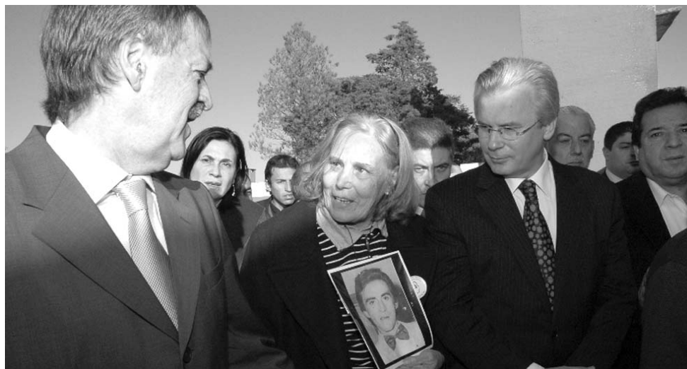
Junto con el gobernador, Baltasar Garzón recorrió los predios de La Perla.

"Siento mucho respeto para un lugar donde se produjo tanto sufrimiento de personas que no habían hecho nada para merecerlo (...) que perdieron su libertad y su vida por el respeto de los derechos de otras personas", afirmó. Pág. 3